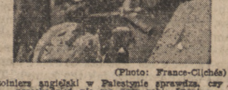
Soldat angielski w Palestynie gwardzki, czy przebieżeni nie ma przy sobie broń.

WASZINGTON. — 14.000 robotników zajętych w fabrykach samochodowych „Hudson” w Detroit zastrzelono na znak protestu. 12 jeden z urzędników został niesłusznie ukarany.