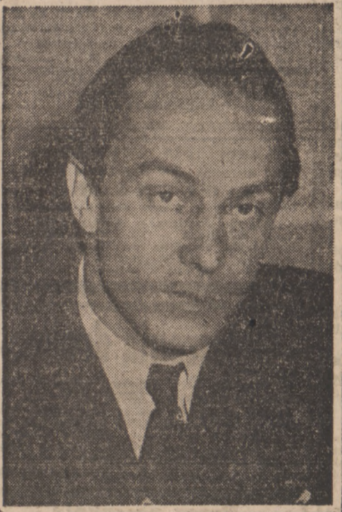
Minister dla spraw miedziolodowych, sztuki i literatury, Pierre Bourdan.