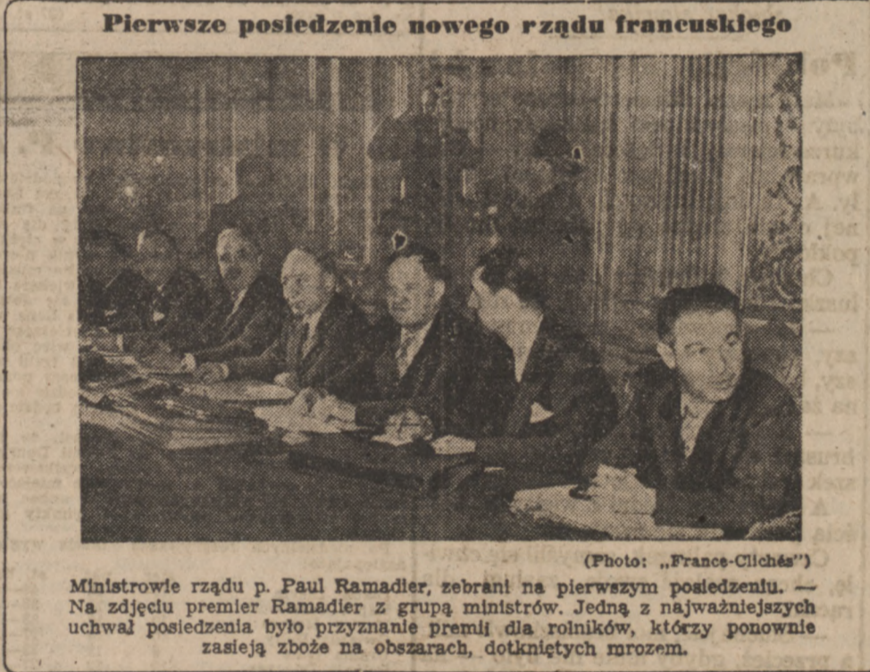
Ministrowie rządu p. Paul Ramadier, zebrani na pierwszym posiedzeniu. Na zdjęciu premier Ramadier z grupą ministrów. Jedną z najważniejszych uchwał posiedzenia było przyznanie premii dla rolników, którzy ponownie zajęli zboże na obszarach, dotkniętych mrozem.

Do zwiększenia produkcji przyczyniło się w wielkiej mierze udzielenie kopalniom pierwszeństwa dla dostawy potrzebnych maszyn i urządzeń.