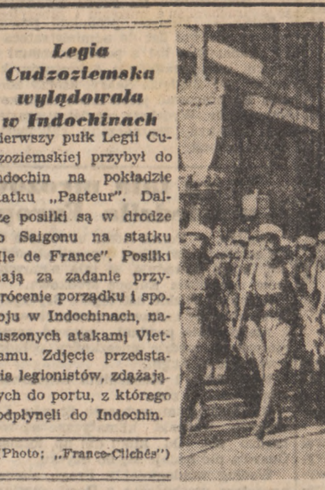
Legia Cudzoziemska wyładowała w Indochinach. Pierwszy pułk Legii Cudzoziemskiej przybył do Indochin na pokładzie statku „Pasteur”...