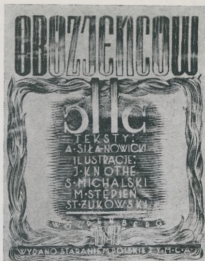
Strona tytułowa „Albumu jeńców II c”, wydanej w 1943 r. w Woldenbergu

Oberbürgermeister, mjr. Ohrt — Polizeidirektor oraz Schikorr — odpowiedzialny za sprawy szkolnictwa. Do najciekawszych z nich należy dwujęzyczne obwieszczenie z 4 września 1939 r. dotyczące zachowania spokoju i spełnienia zarządzeń władz cywilnych i wojskowych (MG/AR/86) 1 . Z 27 września pochodzi rozporządzenie o rozwiązaniu polskich związków i stowarzyszeń (MG/AR/108); 31 października i w listopadzie 1939 r. wydano rozporządzenia o zajęciu majątku polskiego przez władze niemieckie (MG/AR/113, 116). O wznowieniu nauki w szkołach mówia ogłoszenia z października 1939 i 1940 roku (MG/AR/96, 97). Godzinę policyjną dla ludności cywilnej wprowadził rozkaz komendantury z 22 października 1939 r. (MG/AR/112). Rozporządzenie o zakazie wykonywania czynności przez polskich lekarzy, dentystów i techników dentystrycznych wydano 3.X.1939 r. (MG/AR/111). Obowiązek zgłaszania rzeczy posiadanych po wysiedlonych Polakach nakładało ogło-