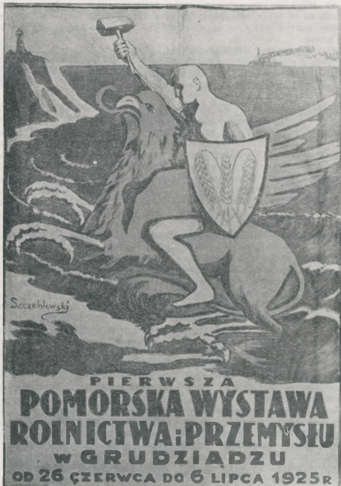
Plakat reklamujący I Pomorską Wystawę Przemysłu i Rolnictwa w Grudziądzu, opracowany przez W. Szczeblewskiego

O udziale grudziądzan w walkach o wyzwolenie Polski w okresie I wojny światowej mówią przede wszystkim dyplomy i wyróżnienia Związku Powstańców i Wojaków O.K. VIII, Związku Weteranów Powstań Narodowych, Komitetu Organizacyjnego byłych Więźniów Ideowych i Politycznych na Poznańskie oraz Komendy Wojewódzkiej Zachodniej Straży Obywatelskiej na Pomorzu (MG/AR/81, 209, 249).