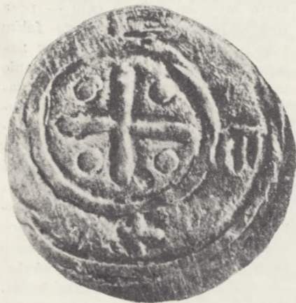
Denar Mieszka I (rewers)

Wystawę otwiera gablota z umieszczonym w niej m.in. denarem Mieszka I. Pierwsza moneta polska — srebrny denar z kapliczką i krzyżem — to znak suwerenności Polski, a także dowód istnienia władzy książęcej zarówno w oczach sąsiadów jak i poddanych. Na wystawie