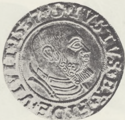
Grosz lenny pruski Albrechta Brandenburskiego (1537)