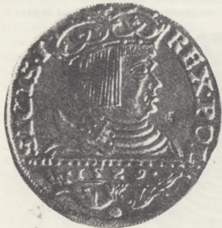
Dukat koronny Zygmunta I