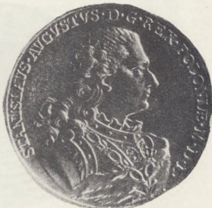
Talar próbny Stanisława Augusta