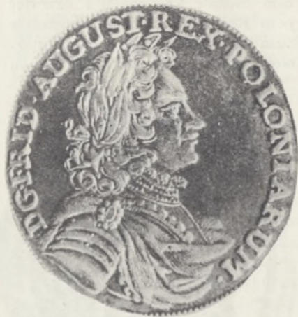
Gulden sasko-polski Augusta II (1701)

Numizmatyczne 1000-lecie Polski zostało zamknięte na wystawie monetami Polskiej Rzeczypospolitej Ludowej. Są to wyłącznie próby monet (100 zł, 20 zł, 10 zł i 5 zł), które na-