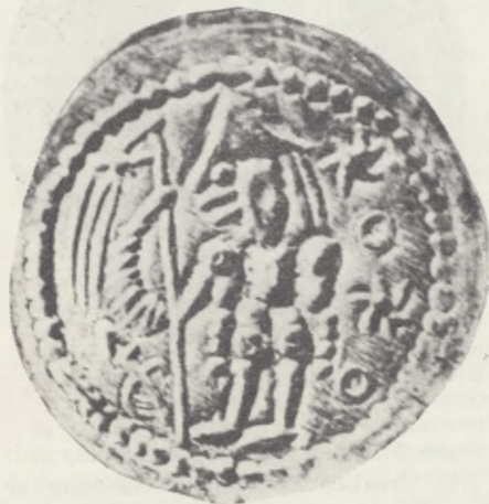
Brakteat niemy Bolesława Wstydlawego (XIII w.)

dem mennic koronnych i dziewięć poza Koroną. Istnieje równocześnie duża ilość znaków mennicznych i herbów podskarbich. Z tego okresu