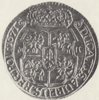
Rv: dukat podwójny Michał Korybut (1671)

MONETA POLSKA NA PRZESTRZENI WIEKÓW. Wystawa ze zbiorów grudziądzkiego Muzeum, zorganizowana w ramach Obchodów Kopernikowskich w pamiętną