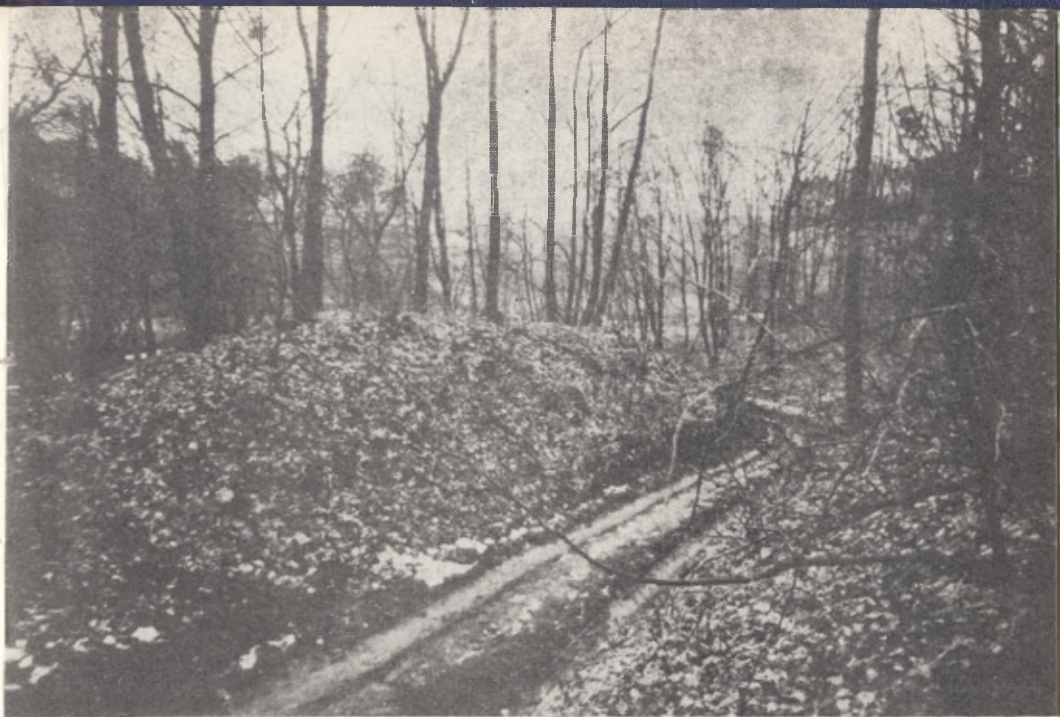
Mędrzyce, pow. Grudziądz. Ogólny widok wału bocznego od strony południowej

wysoczyzny odcięty wałem wypiętrzonym nad jej poziom około 3 m. W wyniku tego powstał obiekt obronny o powierzchni majdanu około 5 arów. Posiada on kształt wydłużonego trójkąta o długości ca 65 m i szerokości podstawy ca 30 m. W połowie majdanu rysuje się dość wyraźnie wypiętrzenie sprawiające wrażenie wewnętrznego wału, dzielącego obiekt na dwie części. Od strony zachodniej grodziska, u podnóża wysoczyzny, stwierdzono dodatkowy, sztucznie uformowany wał, o przeciętnej wysokości 2 do 5 m. Od strony południowej do grodziska przylega najprawdopodobniej nieobronne podgrodzie. Wysokość wypiętrzenia grodziska przez naturalne strome zbocze wysoczyzny nad poziom doliny Osy waha się od 8 do 12 m.