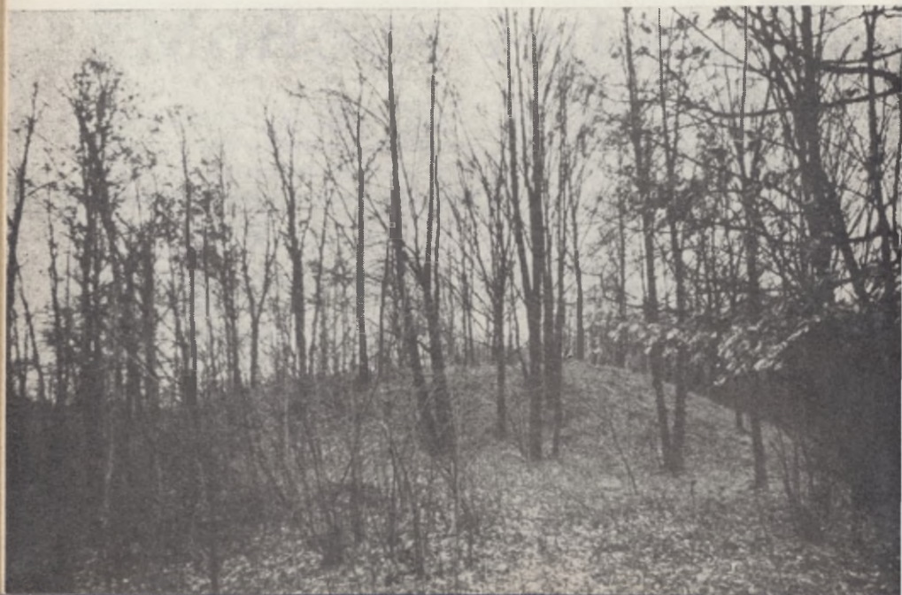
Mędrzyce, pow. Grudziądz. Ogólny widok watau zaporowego