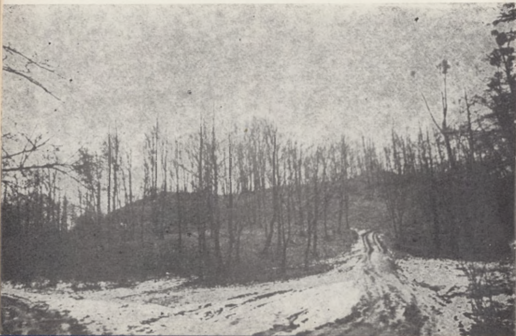
Mędrzyce, pow. Grudziądz. Ogólny widok grodziska od strony północnej

Uzyskane podczas tych prac — głównie z wykopów na majdanie — fragmenty ceramiki reprezentują wyłącznie naczynia całkowicie obtaczone o domieszce schudzającej drobno- i średnioziarnistej. Dominującą formą były naczynia o esowatym profilu, z wylewem wychylonym na zewnątrz i ornamentem w postaci poziomych żłobków występujących na całej powierzchni naczyń. Na szczególną uwagę wśród odkrytego materiału ceramicznego zasługują formy naczyń beczułkowatych o cylindrycznej szyjce. Miały one zdobienia na całej powierzchni brzuśca, z wyjątkiem części przy-