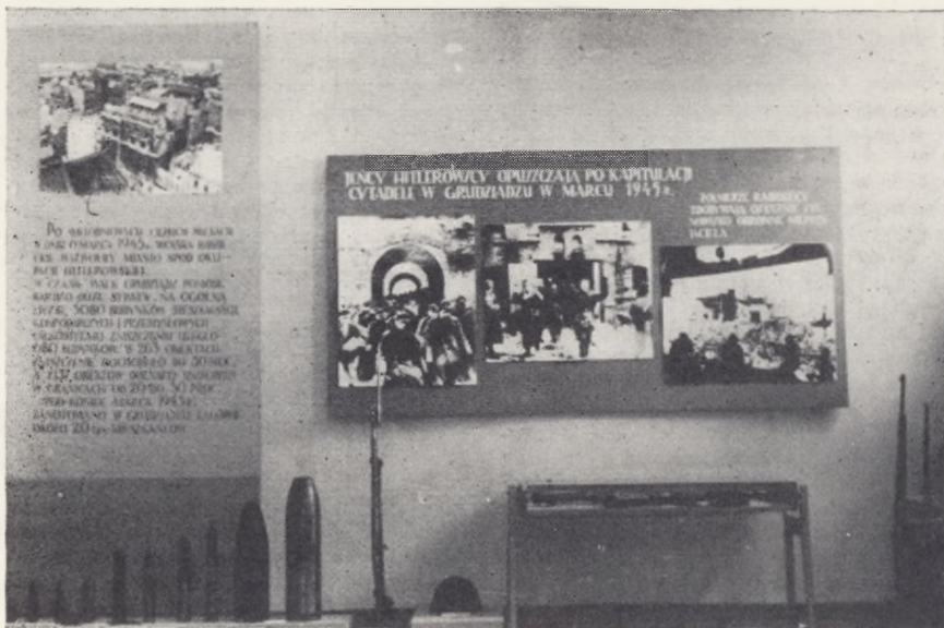
Fragment sali 5 wystawy „IX wieków Grudziądz”

upadku znaczenia Grudziądz jako bogatego i ludnego miasta. Z tych czasów zachowało się sporo numizmów i militariów, m. in. działka lontowe dwu i siedmiolufowe. Na szczególną uwagę zasługują: miedzioryt z widokiem Grudziądz w czasie oblężenia przez wojska szwedzkie w grudniu 1655 (sporządzony w 1656 r. przez szwedzkiego historyka Puffendorfa) oraz oryginalna drukowana ulotka Jerzego Lubomirskiego, marszałka wielkiego koronnego i hetmana polnego, wzywająca szwedzką załogę na zamku grudziądzkim do kapitulacji, a mieszkańcy miasta do udzielenia pomocy wojskom polskim (1659).