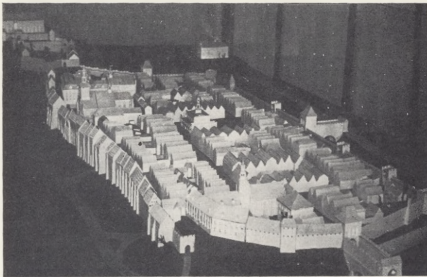
Makieta miasta Grudziądza (XVII—XVIII w.), znajdująca się na wystawie historycznej

Lata tzw. potopu w dziejach Polski, zwłaszcza okupacja miasta przez Szwedów (1655—1659), to okres kataklizmów i