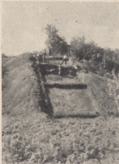
Widok wykopów archeologicznych na wale grodziska w Radzynie Chełmińskim (pow. Wąbrzeźno)

Pełny rozkwit kultury łużyckiej na terenie Ziemi Chełmińskiej przypada na koniec epoki brązu i początek epoki żelaza, tj. okolo 700 lat p.n.e. Nowy metal — żelazo i narzędzia zeń wyrabiane wybitnie wpływają na ulepszenie produkcji rolnej. W tym okresie następuje ekspansja ludności kultury pomorskiej w głąb Wielkopolski, Kujaw i Ziemi Chełmińskiej. Ludność ta charakteryzuje się kulturą grobów skrzynkowych. Nazwa pochodzi od sposobu grzebania zmarłych. Cmentarzyska tego rodzaju są gęsto rozsiane po Ziemi Chełmińskiej. Ostatnio