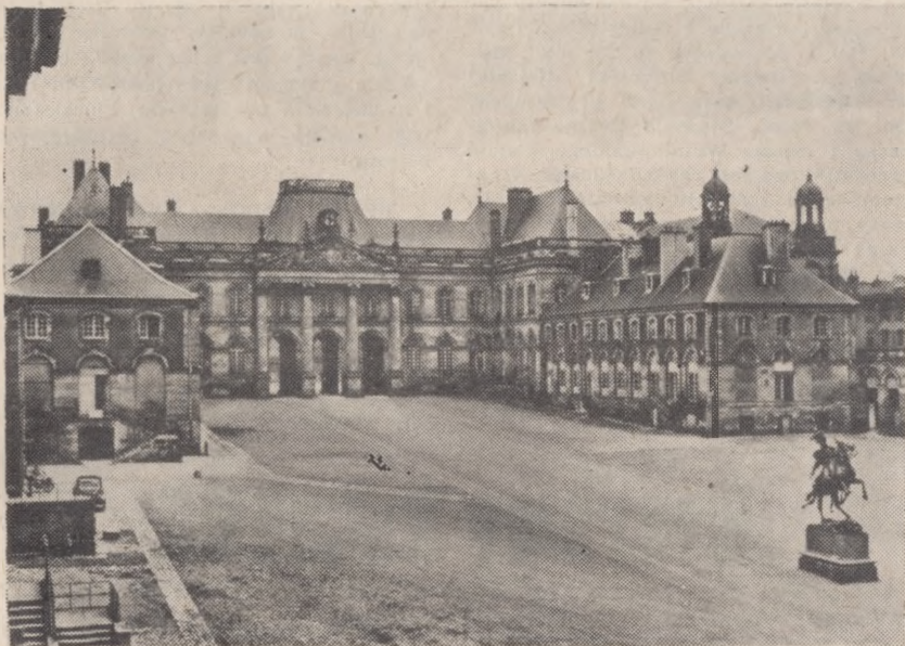
Zamek Stanisława Leszczyńskiego w Lunéville (fasada od strony Placu Honoru); patrz wiadomość na str. 14, zamieszczoną w dziale „Z naszego Muzeum”

Muzeum w Grudziądzu, ul. Wodna 3/5, jest otwarte we wtorki, środy, piątki w godz.: 10.00—18.00, czwartki i soboty w godz. 10.00—15.00, niedziele i święta w godz.: 10.00—14.00. W poniedziałki i dni poświęczone Muzeum jest zamknięte. We wtorki wstęp bezpłatny. W pozostałe dni opłata wynosi: 1 zł, ulgowa 0,50 zł, a dla grup powyżej 10 osób — 0,25 zł od osoby.