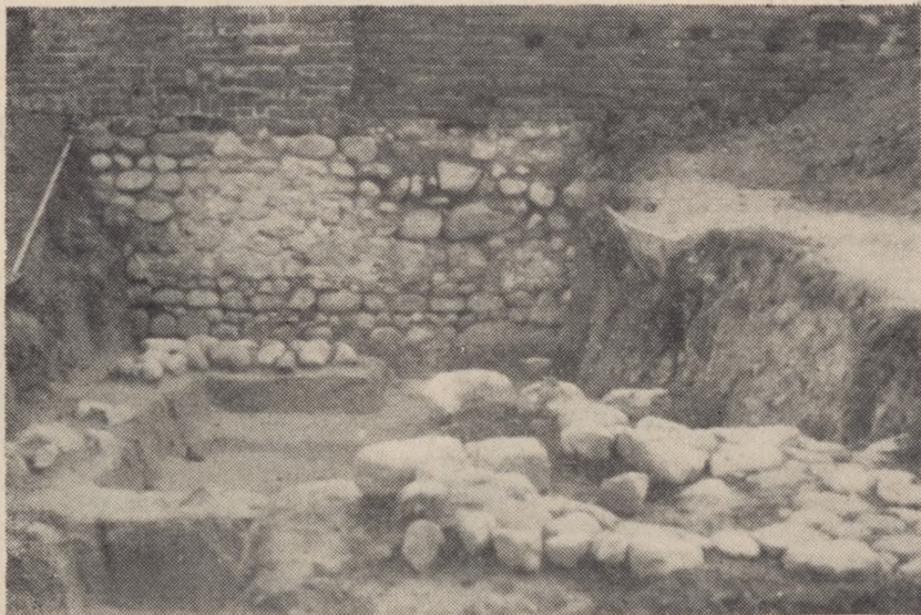
Wykop A; w głębi fundament muru obwodowego przedzamcza w Radzynie Chełmińskim

Gros materiału zabytkowego z badań w Starogrodzie pochodzi z XIV i XV wieku, co niewątpliwie łączyć należy z istnieniem tam zamku krzyżackiego. Sądzić należy, że dalsze badania potrafią wyświetlić zagadnienie konstrukcji grodziska, funkcji zamku i całego zespołu przedzamcza a tym samym być może i hipotezy — czy Starogród był pierwszym przedlokacyjnym Chełmem, którego dotychczas nie udało się jeszcze odkryć. Można już w tej chwili powiedzieć z całą pewnością, że zanim wzniesiono tam zamek krzyżacki, na terenie tym istniało osadnictwo słowiańskie.