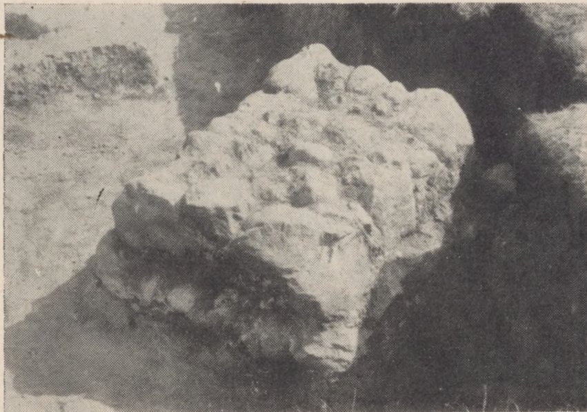
Odkryta baza filaru na przedzamczu w Radzynie Chełmińskim

bliższe przebadanie terenów samego Radzyna Chełm. i najbliższych okolic pozwoliłoby wyświetlić wiele zagadnień osadnictwa przedkrzyżackiego jak i krzyżackiego. Dzięki tym badaniom z pewnością uda się określić wzajemny stosunek grodziska do zamku krzyżackiego.