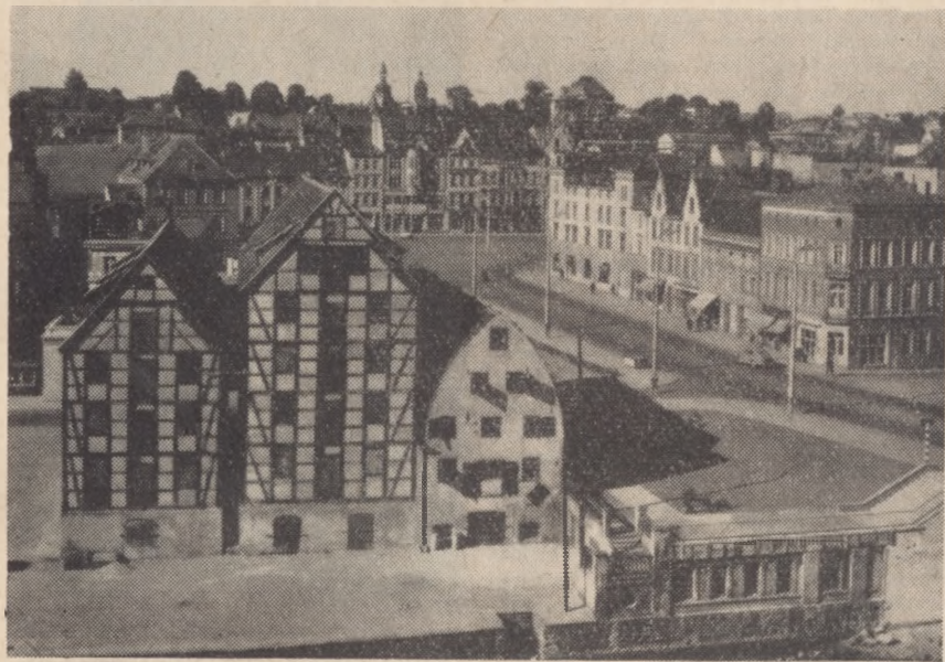
Położenie bydgoskich spichrzy jest centralne; ich najbliższe otoczenie to ul. ul. Grodzka i Mostowa oraz Stary Rynek. Stanowią one dzisiaj istotny element krajobrazowo-urbanistyczny starego miasta

Specyfika poszczególnych dyscyplin plastycznych (malarstwo, grafika i rzeźba) reprezentowanych w muzeum oraz racje podziału pracy naukowo-badawczej i społeczno-oświatowej dyktują potrzebę utworzenia w jego strukturze kilku podstawowych działów. Zatem omawiane muzeum będzie jednocześnie instytucją specjalistyczną i wielodziałową. Obejmie ono zasięgiem swoich zbiorów całą Polskę i dlatego też powinno być zaliczone do instytucji muzealnych o specjalnym znaczeniu. Bezpośredni nadzór nad muzeum ma być powierzony Prezydium Wojewódzkiej Rady Narodowej w Bydgoszczy, które zapewni mu potrzebne środki finansowe dla jego utrzymania i rozwoju. Na wyniki działalności instytucji składać się będzie