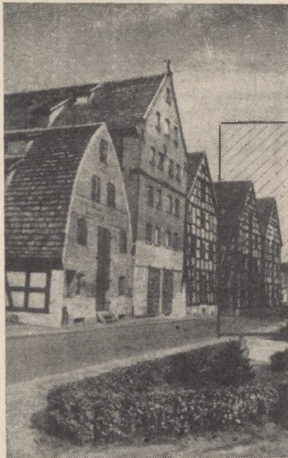
Tak do niedawna wyglądała od ul. Grodzkiej elewacja zespołu pięciu spichrzy; dwa ostatnie z prawej strony strawił wielki pożar w 1960 r.

statecznym stopniu problematyki związanej z dokumentacją różnych dziedzin współczesności. Mankament ten w całej rozciągłości dotyczy też tej dziedziny współczesnego życia społecznego jaką jest sztuka, przez którą rozumiemy dzisiaj najdoskonalszy wytwór działalności ludzkiej, łączącej w sobie najpełniej umiejętność techniczną z doskonałością inwencji twórczej. Dzięki niej — twierdzą historycy sztuki — ludzkość sublimuje swój byt i przydziela jemu znacznie większe znaczenie.