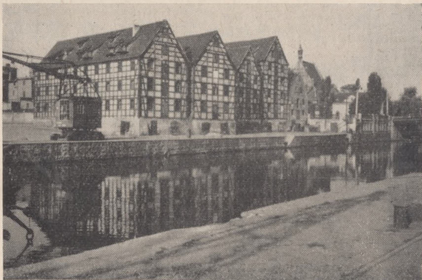
Spichrze nad Brdą w Bydgoszczy; patrz artykuł pt. „Pilny postulat muzealnictwa doczeka się realizacji”, str. 3.

zne Muzeum jest zamknięte. We wtorki wstęp bezpłatny. W pozostałe dni opłata wynosi: 1 zł, 0,50 zł (ulgowa), a dla grup powyżej 10 osób — 0,25 zł od osoby.