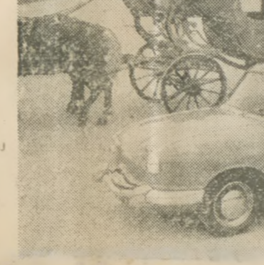
W wierszu zestawiono dwa środki lokomocji: uroczą markiza (tancerka Lucette Darsonval) porusza historyczną karocę i wsiada do nowoczesnego samochodu.