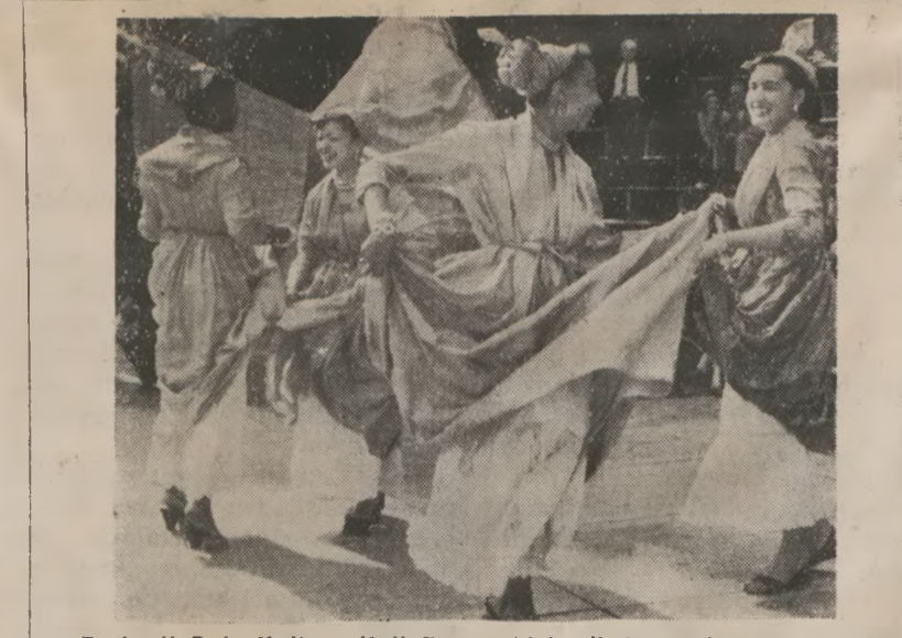
Z okazji Dnia Kultury Unii Francuskiej odbyły występy grup narodowych w starym amfiteatrze rzymskim (Arenes de Lutecy) w Paryżu. Na zdjęciu grupa mieszkanców Martyniki w swoim tancu narodowym.

Nie tak dawno temu chirurg lub akuszer mył sobie ręce dopiero po operacji, toteż śmiertelność — zwłaszcza przy porodach — była olbrzymia. Właśnie dzięki higienie życie ludzkie zostało przedłużone o wiele lat. (B.)