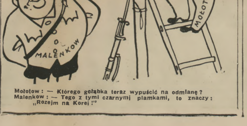
Motowł — Którego gołąbka teraz wypuścić na odlanie? Malenkow: — Tego z tymi czarnymi plamkami, to znaczy: „Rozejm na Korei!”