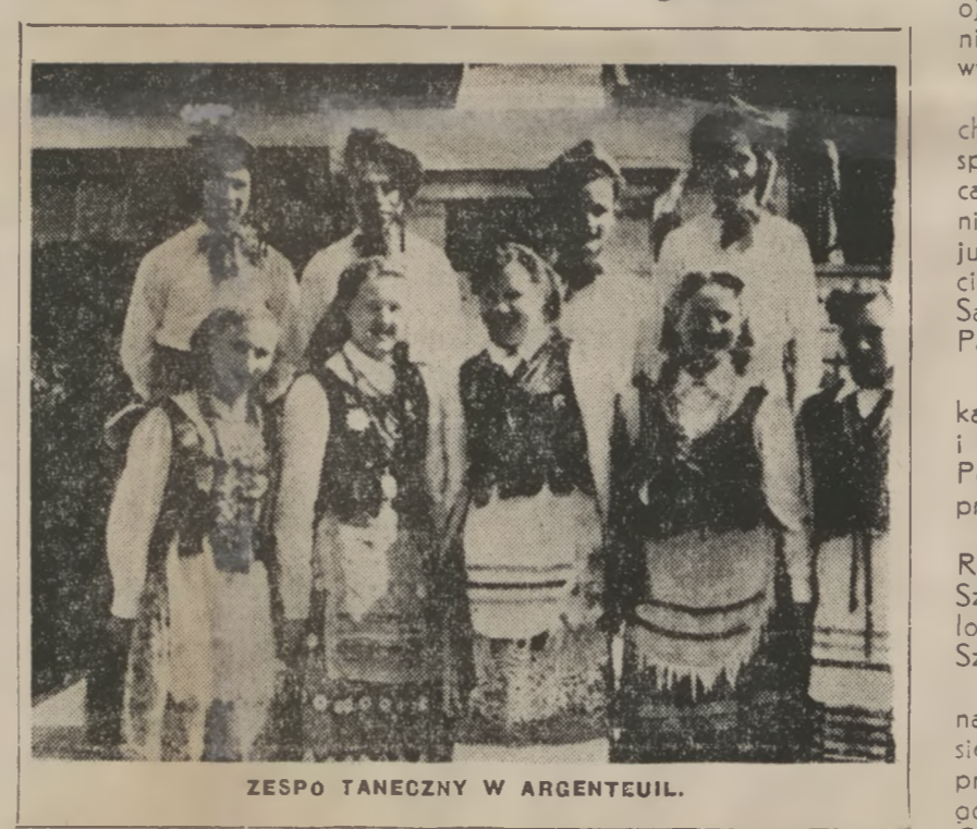
ZESPÓŁ TANEWCZY W ARGENTEUIL.

Polaków tu dużo — ponad 250 rodzin. Mieszkają przeważnie jako lokatorzy w starych domach czynszowych.