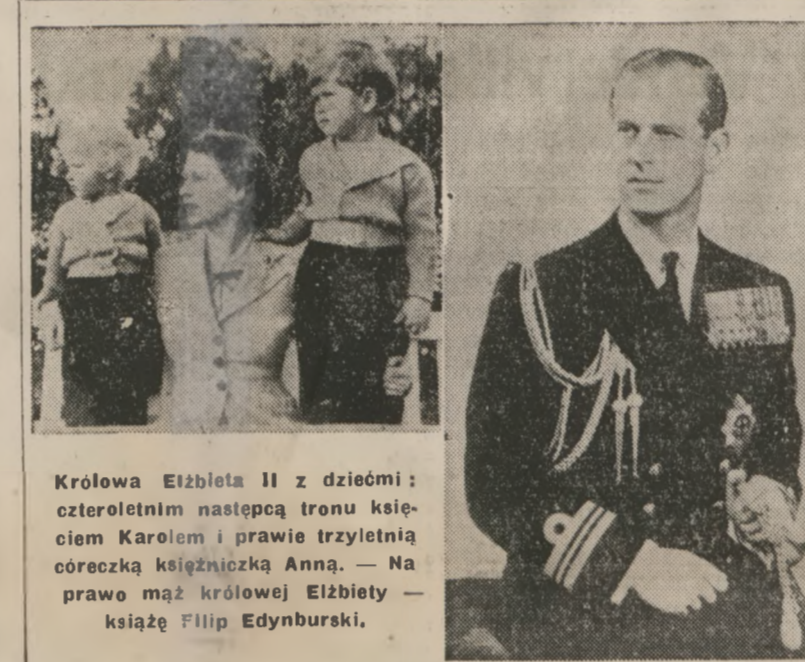
Królowa Elżbieta II z dziećmi: czterolatni następcą tronu księciem Karolem i prawie trzylatnią córeczką księżniczką Anną...