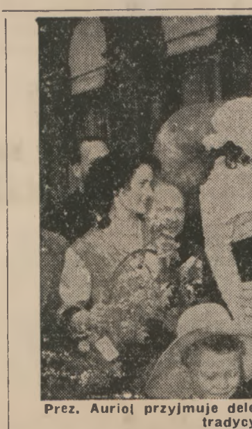
Prez. Aurioł przyjmuje delegację pracowników Hal paryskich z tradycyjną konwulką.