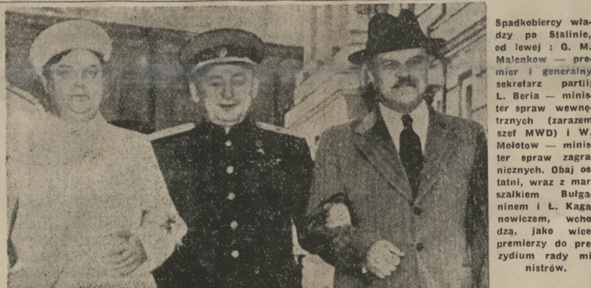
Spadkobiercy władzy po Stalinie, od lewej: G. M. Malenkow — premier i generalny sekretarz partii; L. Beria — minister spraw wewnętrznych (zarazem szef MWD) i W. Mołotow — minister spraw zagranicznych. Obaj ostatni, wraz z marszałkiem Bułganinem i L. Kaganowiczem, wchodzi, jako wicepremierzy do prezydium rady ministrów.

Londyn (A. P.). — Ambasador sowiecki, Cromyko, odleciał do Nowego Jorku, gdzie zajmie w O. N. Z. miejsce Wyszyńskiego w okresie jego nieobecności. Przypuszcza się, że nieobecność ta może potrwać długo.