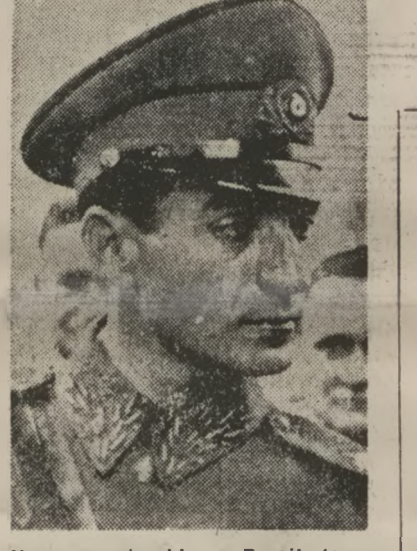
Nowe zamierzenia w Persji toczone są okolo osoby szacha, młodego Mahometa Pahlawi, który, popierany przez Kaszanego przeciwstawia się premierowi Mossadekowi i, jak się wydaje, przegrat.

Teheran (A. P.) — Genezą ostatnich zdarzeń w Teheranie jest plan Mossadeka „wyjaśnienia sytuacji” przed oficjalnym ogłoszeniem faktu, iż rokowania naftowe skończyły się fiaskiem. Fakt ten spowodował wzrost ceny ropy, a na których spoczywa cały ciężar deficytu budżetowego, spowodowanego przez unieruchomienie przemysłu naftowego.