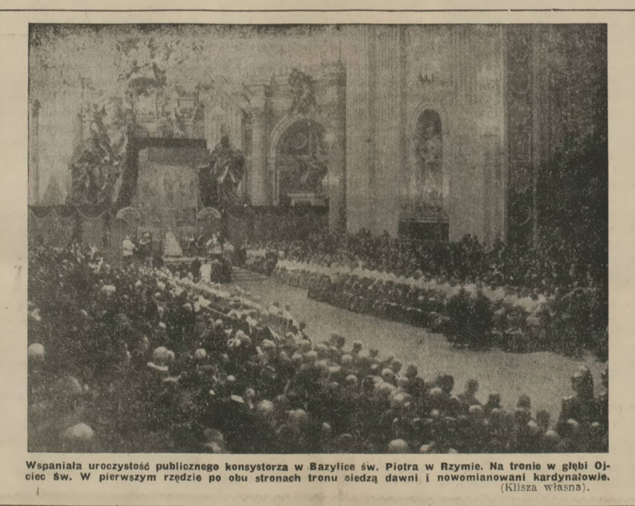
Wspaniała uroczystość publicznego konsystorza w Bazylice św. Piotra w Rzymie. Na tronie w głębi Ojciec św. W pierwszym rzędzie po obu stronach tronu siedzą dawni i nowomianowani kardynałowie.