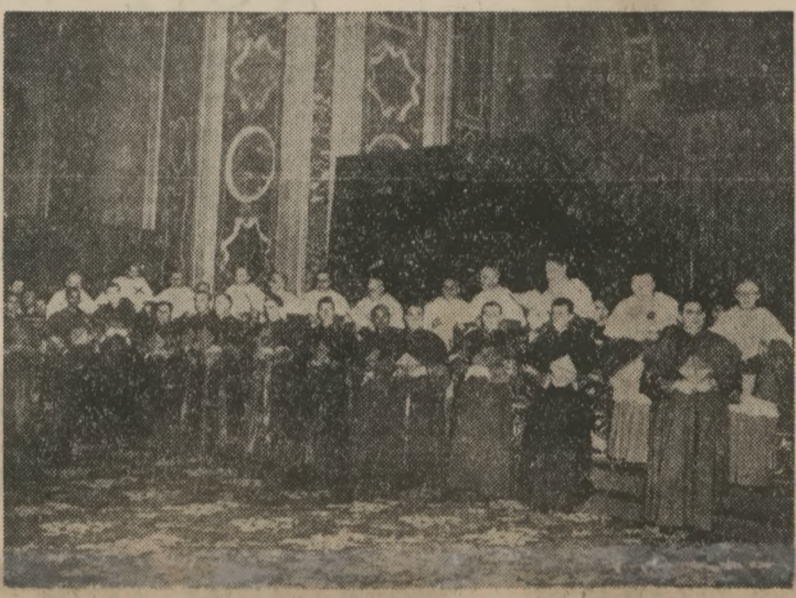
Nowo mianowani kardynałowie. Drugi od prawej arcybiskup Paryża ks. kard. Felin. Przedostatni (oznaczony krzyżykiem), pierwszy w dziejach Kościoła, członek św. Kolegium Hindus ks. kard. Gracias.