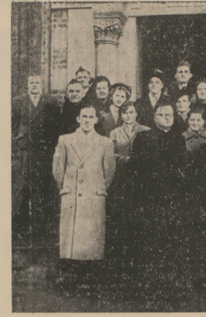
POLSKI CHÓR KOŚCIELNY Z MERICOURT-MAROC-NOYELLES