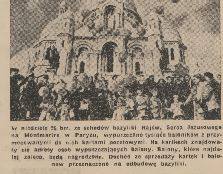
W niedzielę 26 bm. ze schodów bazyliki Najsw. Serca Jezusowego na Montmarrie w Paryżu, wypuszczono tysiące baloników z przywiezionymi do nich kartkami pocztowymi. Na kartkach znajdowały się adresy osób wypuszczających balony. Balony, którymi najdalej zaleca, będą nagrodzone. Dochód ze sprzedaży kartek i balonów przeznaczono na odbudowę bazyliki.

Przy pomocy «tranzystorów» prostuje się już prąd zmienny i wzmacnia słabe. Niedawno w jednym z laboratoriów nowojorskich demonstrowano kryształek germanium tak mały, że uchwycić go można było tylko szczyptkami, a posiadający wydajność 50 lamp elektronowych.