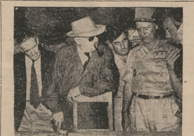
P. Jean Letourneau, minister-rezydent oraz gen. Raoul Salan, naczelny dowódca sił francusko-wietnamskich w Indochinach, omawiają sytuację na froncie.