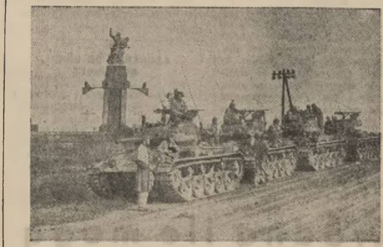
Francuska druga dywizja pancernej podczas ćwiczeń. — Przed namiem, oddziałami pancernymi oczekują na rozkaz. — W tle widzimy pomnik, gdzie spoczywają zwłoki Gen. Gourauda.

Rzym (A.F.P.). — Profesor astronomii na uniwersytecie we Florencji Giorgio Abetti ogłosił nową teorię o latających spódkach. Są one — zdaniem uczonego — małymi planetami, które poruszają się bardzo szybko i pozostawiają po sobie brzęk doświetlone. Planety te mogą zbliżyć się do ziemi na przedział kilku dni i następnie w sposób tajemniczy zniknąć.