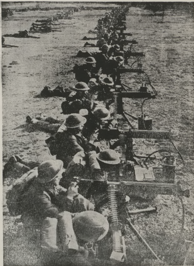
Przygotowania obronne w Anglii.

W tym duchu złożył ostatecznie oświadczenie premier rządu greckiego Korizis przemawiając do robotników w Atenach i Pireusie. Podkreślił on, że naród grecki zdecydowany jest nie ustąpić ani piędzi ziemi. Mówca wyraził swe uznanie dla ofiar złożonych oszczędnie przez robotników greckich i podkreślił zdecydowanie ich do stawienia czoła wszelkim atakom na wolność. "Jesteśmy pewni - stwierdził premier - że walka, którą rozpoczęliśmy 28 października prowadzona będzie nadal z tym samym bohaterstwem