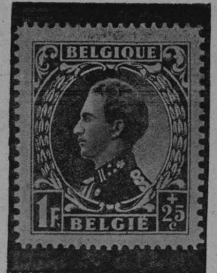
Belgia wydała nowe znaczki z podobizną nowego króla Leopolda III.