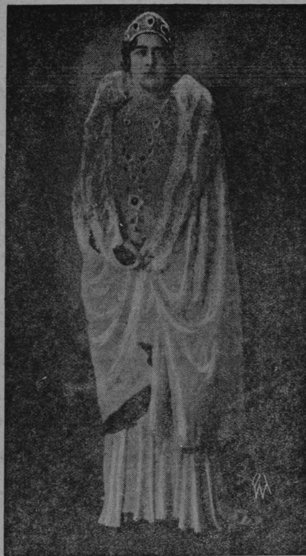
Królowa jugosławińska Marja

siołowski, najwytworniej, Katenbrig, najkrócej Szaniawski. Po mowie Katenbriga, król miał się spytać po cichu Naruszewicza: