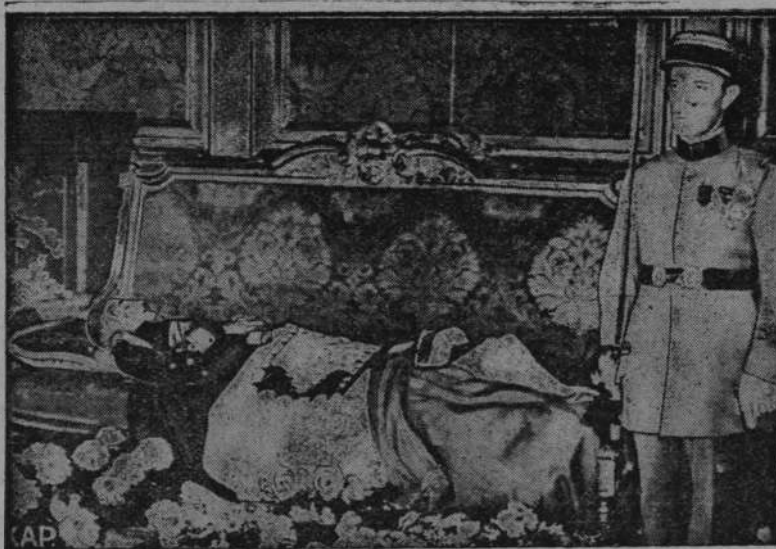
Zamordowany w Marsylii Król Aleksander I.