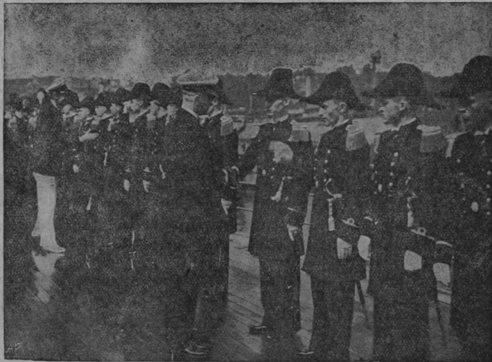
Promocja absolwentów marynarki w Gdyni.