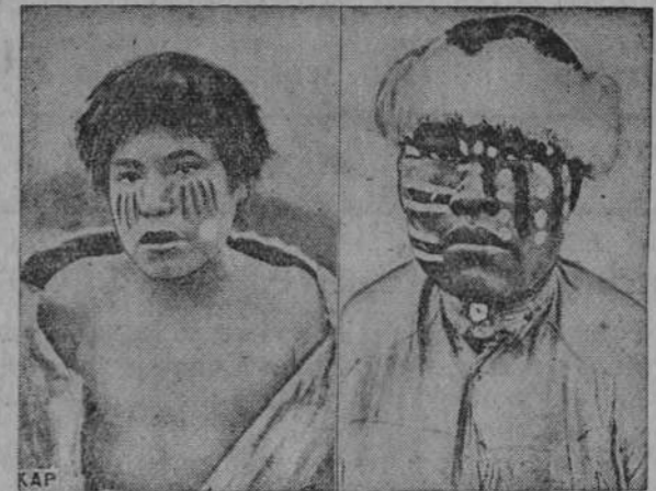
Upiększenia i ozdoby pary nareczeńskiej Indjan w Jamana.