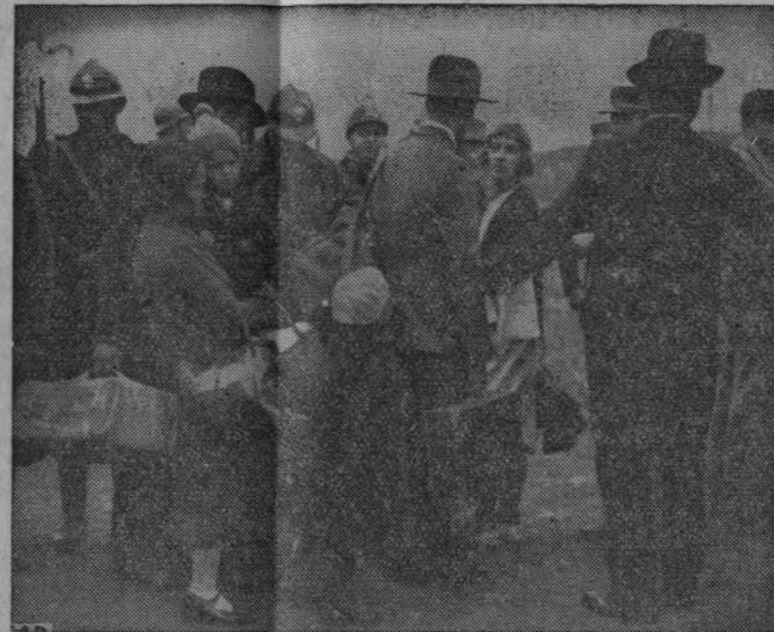
Wydalenie robotników polskich z Francji.