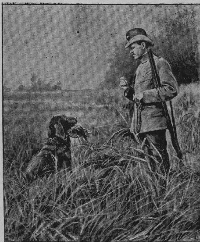
Rozpoczęło się polowanie na kuropatwy i bażanty. Po pustych polach chodzą strzelcy szukając szczęścia myśliwskiego.