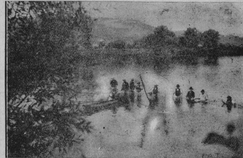
Zdjęcie nasze przedstawia scenę z wielkiego polowu ryb w Dunajcu. Sieci zakładane są w klin od mielizny skalnej t. zw. garbu do brzegów. 80-u do 100 ludzi napędza ryby w klin. Polów taki daje zazwyczaj kilka centnarów białej ryby rzecznej. Na ilustracji naszej widzimy moment zamykania klinu.