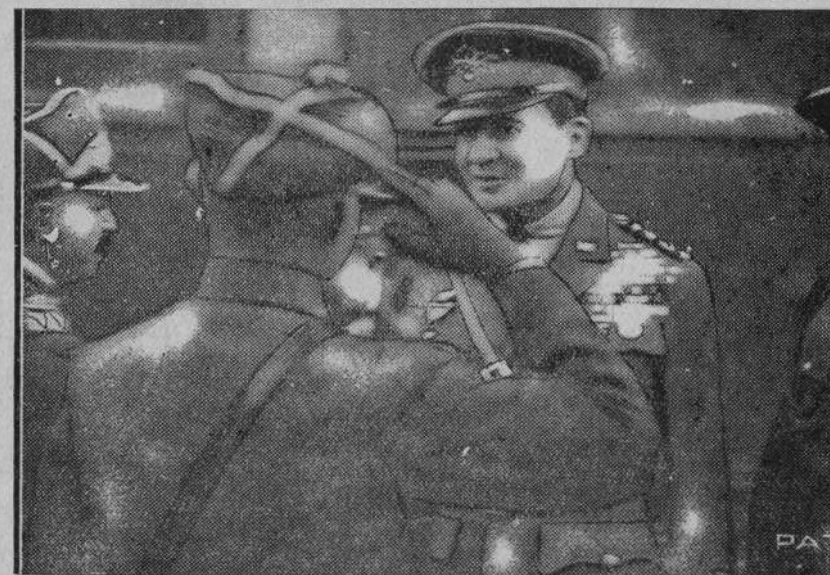
Bawił w Polsce szef sztabu armii Stanów Zjednoczonych Ameryki Północnej gen. Mac Arthur. — Ilustracja nasza przedstawia gen. Mac Arthura na dworcu głównym w Warszawie.