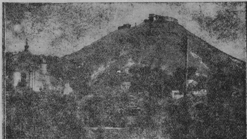
Ilustracja nasza przedstawia piękny widok z tarasu przed kościołem Liceum Krzemienieckiego na górę Królowej Bony z ruinami zamku, wniesionego przez Wielkiego Księcia Witolda. Na lewo widzimy sobór św. Mikołaja — dawny kościół O. O. Franciszkanów, zbudowany w r. 1606 przez książąt Wiśniowieckich w stylu barokowym.