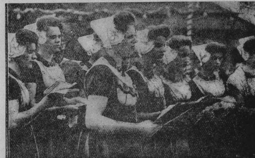
Piękne są stroje wieśniaczek z Zelandji (w południowej Holandji). Na ilustracji naszej widzimy chór dziewcząt z Kouderkerke podczas popisu na koncercie w Hadze.