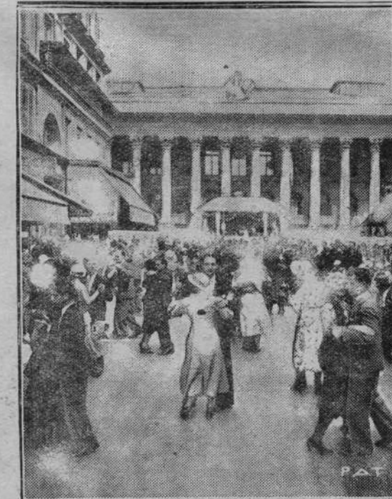
Z okazji święta narodowego francuskiego, urządzanego rok rocznie w dzień zdobycia Bastylji, odbyły się we wszystkich miejscowościach francuskich, a przede wszystkim w Paryżu, zabawy ludowe, organizowane na ulicach. Na zdjęciu naszym widzimy tańce ludowe na wielkim placu Giełdy w Paryżu.