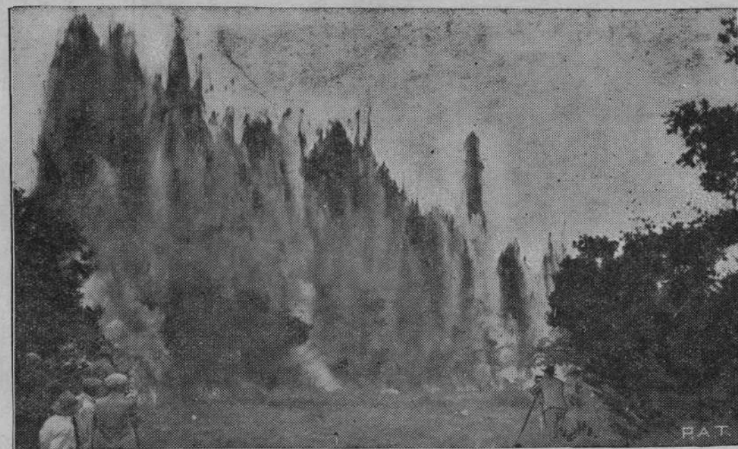
Przed kilku dniami użyto po raz pierwszy w Polsce dynamitu do prac meljoracyjnych, mianowicie w celu wyrównania bardzo krętego biegu rzeki Orzuc pod Drożdżowem na Polesiu, połączono dwa węzły rzeki liną nabojuw dynamitowych, których wybuch utworzył nowe, głębokie i równe koryto rzeki. Ilustracja nasza przedstawia groźny widok wybuchu pół-tonowego ładunku dynamitu. Praca ta wykonana została przez Państwową Wytwórnę Prochu pod kierunkiem inż. Raczyńskiego.