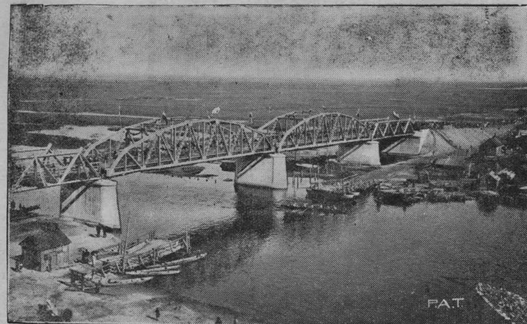
Podajemy fotografję świeżo otwartego mostu drogowego przez rzekę Pinę. Most ten zbudowany na terenie bagnistym ma 133 m. długości i stanowi piękny okaz polskiego budownictwa mostowego.