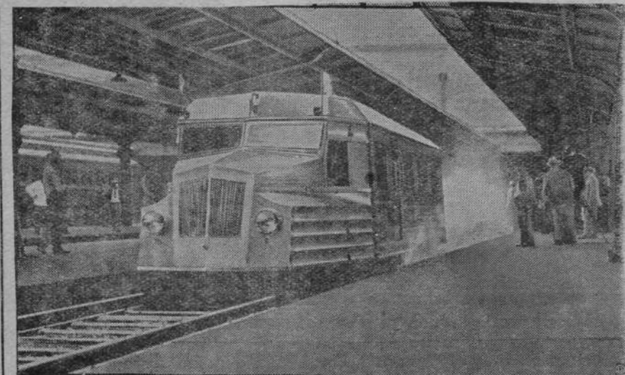
FRANCUSKI ZEPPELIN NA SZYNACH.