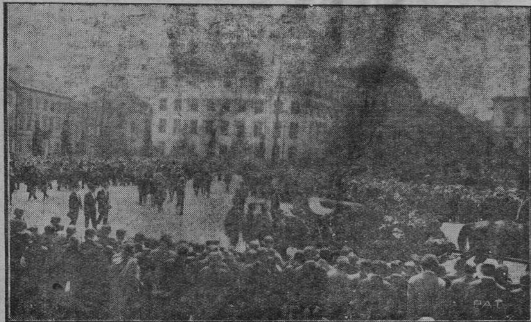
W dniu 30 maja przed południem odbyła się w gmachu ambasady tureckiej w Warszawie eksportacja zwłok zmarłego przed kilku dniami ambasadora tureckiego J. E. Dzewida Beja.