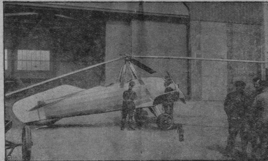
Samolot niemiecki ze śmigłem wiatrakowym który pokazano pierwszy raz w Bremie