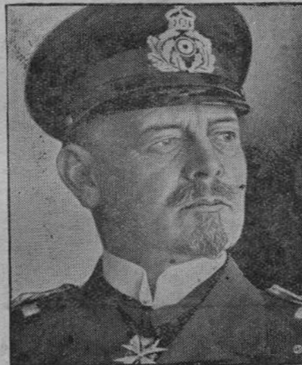
W wieku 68 lat zmarł w Altona admirał Hipper dowódca floty niemieckiej w czasie wojny światowej. Był on też dowódcą floty w bitwie pod Skagerrak.