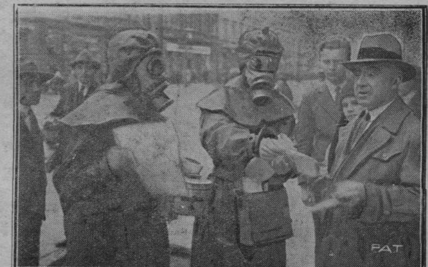
TYDZIEŃ L. O. P. P. W WARSZAWIE.