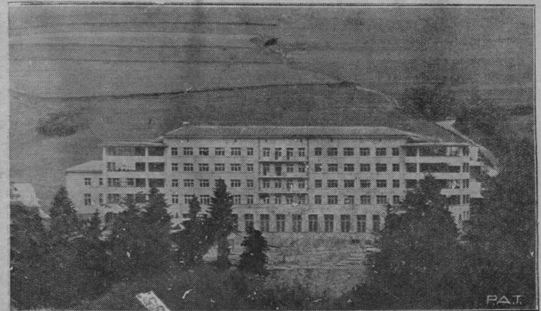
Na zdjęciu naszym podajemy widok nowego sanatorium akademickiego w Zakopanem.