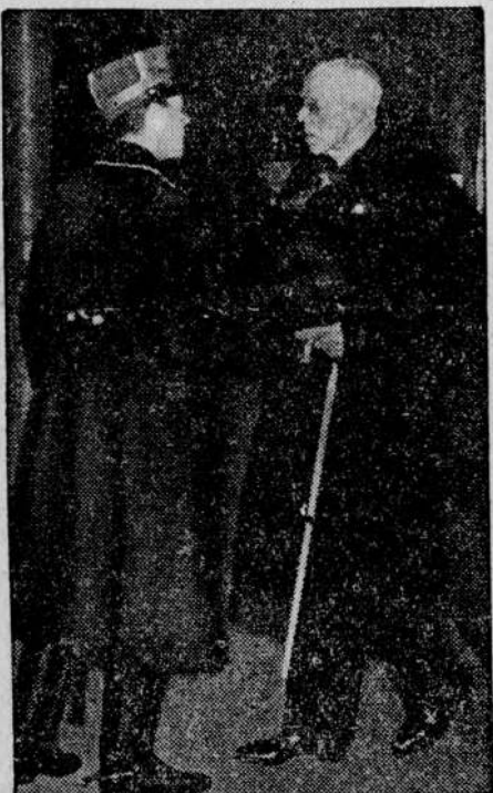
Król Szwecji Gustaw V był w tych dniach gościem Niemiec, przybywając na międzynarodowy turniej hipiczny do Berlina. Na zdjęciu popularny władca Szwecji w towarzystwie swego siostrzeńca Ks. Gustawa Adolfa na dworcu berlińskim