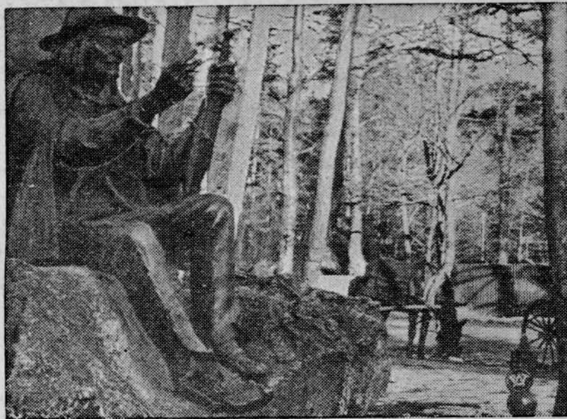
Rzeźba słynnego przewodnika i gawędziarza tatrzańskiego Sabaly na pomniku Chałubińskiego dłuta art. rzeźb Malborczyka.

Dotychczasowe nasze spore już osiągnięcia, nie powinny wpłynąć na osłabienie tempa pracy. Przeciwnie, winny być podjęta do dalszych wysiłków i poczynań. To też w rocznicę powrotu morza do Polski — nie zapominając o wspaniałym rozwoju Gdyni, największego dziś portu na Bałtyku, w roku 1937 bowiem, ruch statków handlowych wyniósł 5,6 milionów ton rej. netto, nie zapominając, że polska bandera dociera w stałej komunikacji do Ameryki Północnej i Południowej, Afryki i Azji — myśli nasze