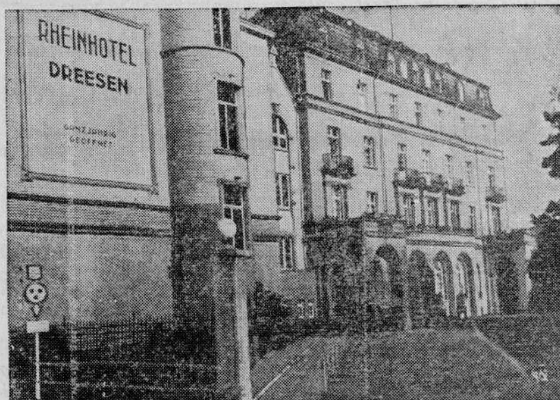
Rheinhotel Dreesen w Godesborgu, gdzie we czwartek dnia 22 września nastąpiła druga rozmowa Hitlera z Chamberlainem.