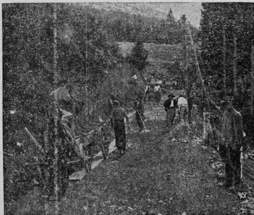
Fragment prac, przy budowie specjalnej drogi z Zakopanego do doliny Chochołowskiej. Nawierzchnia tej drogi zostanie przystosowana do transportu gondoli, powłoki balonu precyzyjnych instrumentów i przyrządów naukowych, oraz nawigacyjnych, jakoteż intensywnego ruchu turystycznego, spodziewanego w okresie startu.

LONDYN W Londynie specjalny oddział Scotland Yard'u dokonał rewizji w domu jednego z byłych oficerów gwardii pruskiej. Mieszkał on w dzielnicy wilowej uchodząc za bogatego kupca. Nagle zarządzona rewizja stwierdziła, że dom owego oficera był nie tylko centralną propagandą narodowo-socjalistycznej, lecz również dobrze zakonspirowaną placówką szpiegowską. Przeprowadzona nagła rewizja dostarczyła dostateczną ilość dowodów.