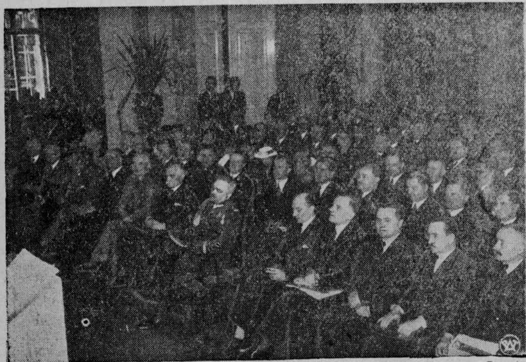
Fragment z obrad Rady Naczelnej O. Z. N. w sali Oficerskiego Kasyna Garnizonowego. W pierwszym rzędzie, w gronie członków Rady Naczelnej, siedzi Pan Premier gen. Sławoj - Składkowski.

Po powitaniu na dworcu minister Beck z małżonką odjechali do zarezerwowanych dla nich apartamentów.