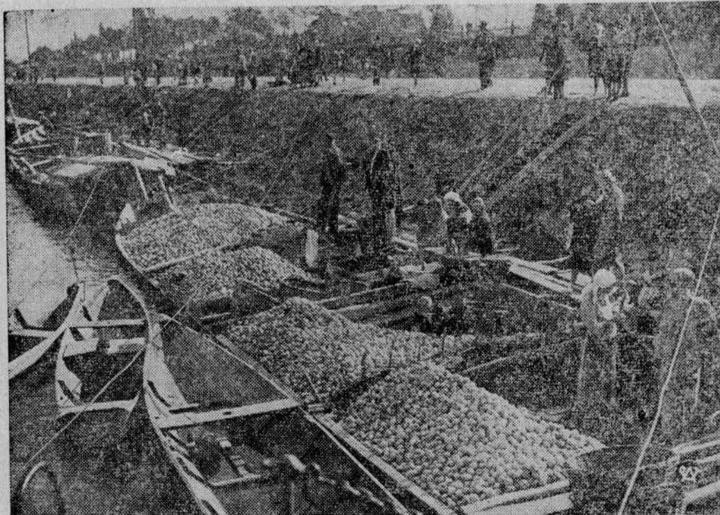
Sezonowe transakcje owocowe nad Wisłą.

Winnych niestosowania się do tego zarządzenia, należy pociągnąć do odpowiedzialności karno-administracyjnej.