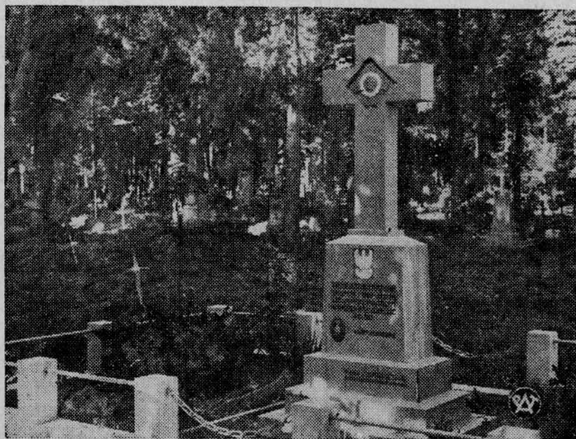
Pomnik ku czci poległych legionistów na cmentarzu w Czerniowcach.