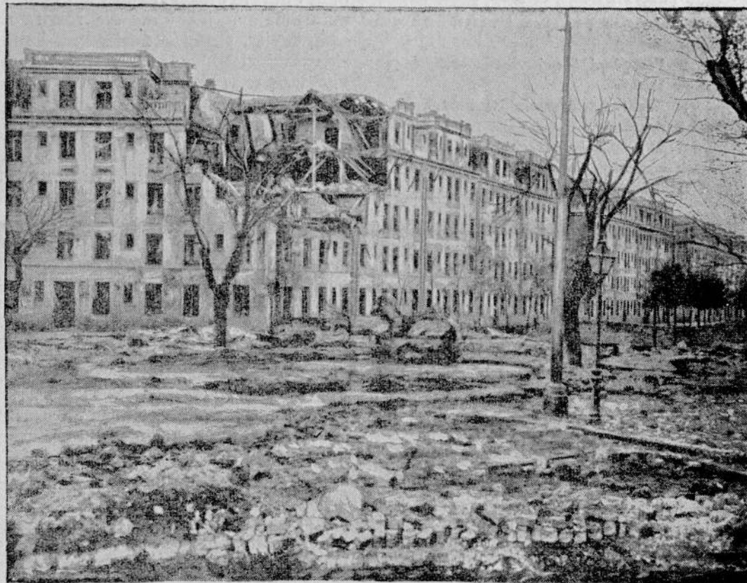
Jedna z ulic Madrytu po wyczynach czerwonych.

SALAMANKA. Komunikat naczelnego dowódcy sił zbrojnych gen. Franco donosi, iż na froncie Madrytu wobec niepogody nie było żadnych starć. Na froncie w Asturii dnia 27 bm. odparto krwawy atak czerwonej mili-