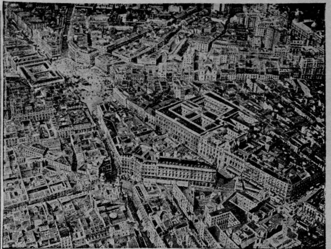
Na zdjęciu stolica Hiszpanii Madryt, która liczy 800.000 mieszkańców. —