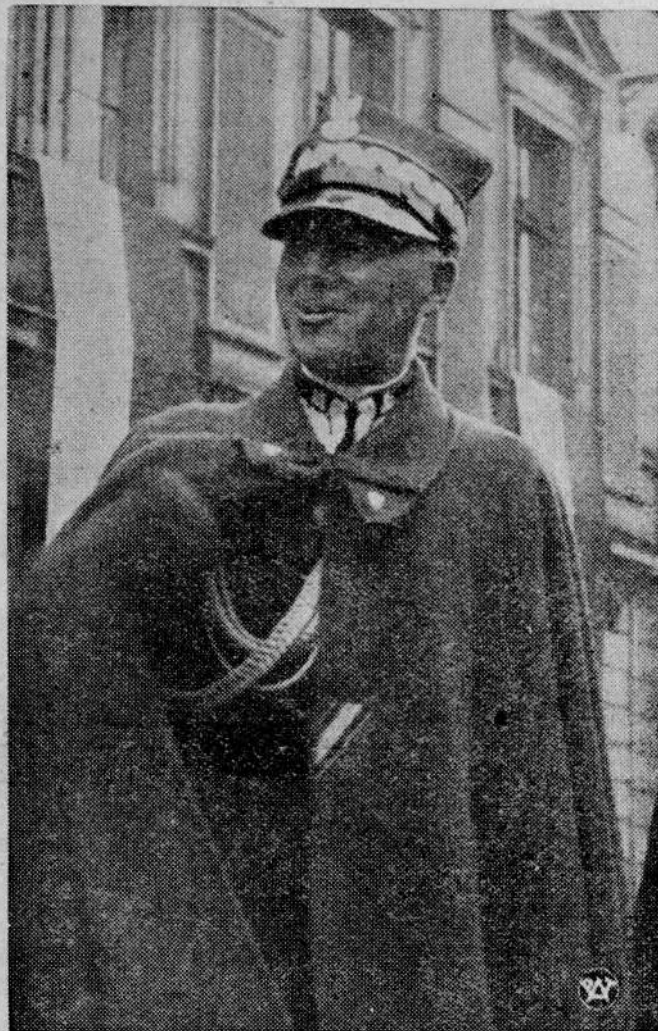
Na zdjęciu: Naczelnny Wódz gen. Rydz-Śmigły uśmiechem dziękuje tłumom wznoszącym okrzyki na jego cześć na dworcu kolejowym w Katowicach.