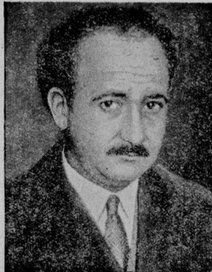
General Franco kierownik hiszpańskiego ruchu powstańczego.

Z rozszerzeniem powstania wojskowego w Hiszpanji, opanowuje ulice coraz więcej czerwona milicja. Po ciężkich walkach w mieście odprowadzają członkowie czerwonej milicji członków związków pravicowych.