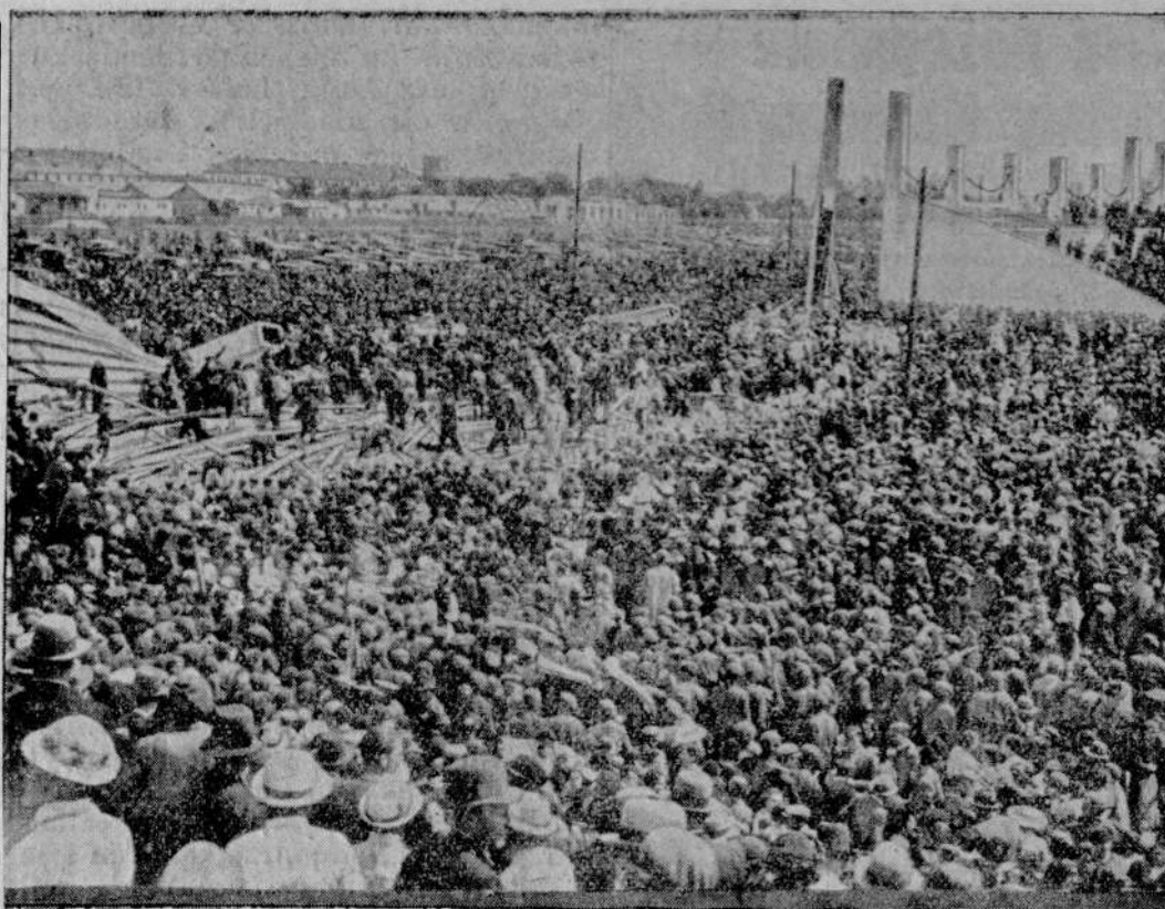
Donosiliśmy o wielkiej katastrofie, która miała miejsce w Bukareszcie, — gdzie się podczas defilady zawałowała jedna z trybun, 5 osoby zostały skutkiem tego zabite a około 100 odniosło rany. Na obrazku: Część zawałowanej trybuny.

Dyrektorat Klajpedy podaje do wiadomości, że litewska policja państwowa sporządziła spis zabronionych niemieckich książek oraz pomocy naukowych. Spis ten obejmuje 148 pozycji. Zakazane zostały 4 śpiewniki, czytanki szkolne, krajoznawcze i hi-