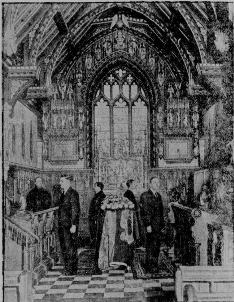
W wiejskiej kaplicy.

W londyńskim Hyde Parku artylerja gwardji królewskiej oddała strzały w odstępach jednonminutowych. Wystrzałów tych oddano 70.