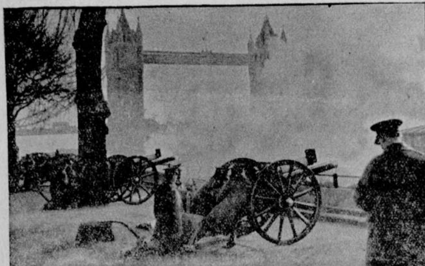
Salwy armatnie na cześć zmarłego króla.

W londyńskim Hyde Parku artylerja gwardji królewskiej oddała strzały w odstępach jednonminutowych. Wystrzałów tych oddano 70.