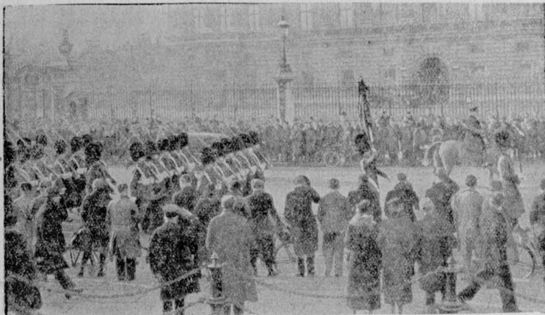
Gwardja królewska w żałobie.

Zwłoki Jerzego V przeniesiono w czwartek do Londynu. — Przedtem zwłoki spoczywały w kaplicy w Handringham. Wnętrze tej kaplicy widzimy obok. Służba zamkowa pełniła pierwszą straż przy zwłokach. Kaplica przez całą srodę była miejscem pielgrzymek olbrzymich tłumów które przybyły nawet z dalekich stron, by się pożegnać z zmarłym królem. Gdy trumna wyniesiono z kaplicy, król Edward i jego bracia poszli za trumną całe 8 klm. pieszo do stacji kolejowej. Królowa i pozostali członkowie rodziny jechali autami.