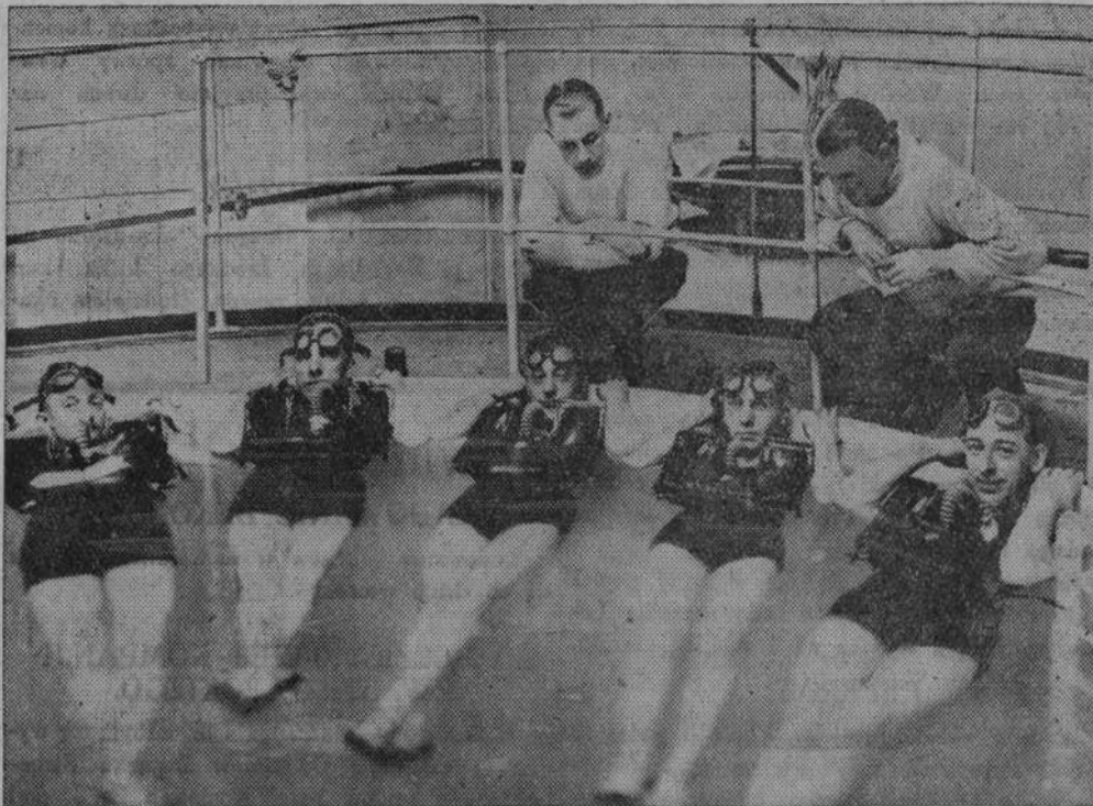
Angielscy marynarze łodzi podwodnych w czasie ćwiczeń z nowym aparatem do nurkowania, który pozwala na 2 godzinne przebywanie pod wodą. Aparat ten po wypełnieniu go powietrzem służy jako pływak.