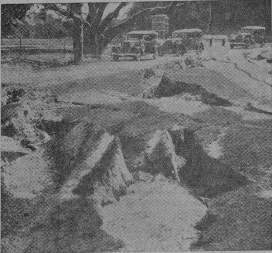
Ciężkie trzęsienie ziemi nawiedziło miejscowość Muzaffarpur. Trzęsienie ziemi trwało pół minuty. Kilka domów zostało zawalonych. Jest kilku zabitych i większa ilość rannych.