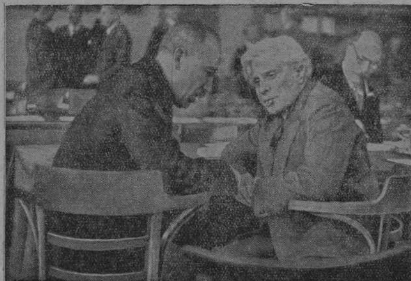
Francuski minister spraw zagranicznych w rozmowie z generalnym sekretarzem konferencji czechosłowackim ministrem spraw zagranicznych Benesem.