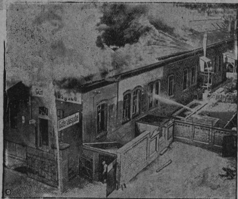
Olbrzymi pożar na dworcu w Hanowerze.

Jak wiadomo, Andree przed 30 laty przedsięwziął naukową podróż balonem do bieguna północnego i uległ katastrofie, pomimo poszukiwań nie został ocalony a zwłoki jego dopiero w tych dniach odkrył w lodzie badacz stref polarnych.