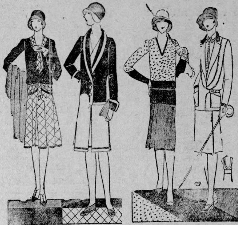
Nowe modne kostjomy jesienne i suknie.

Słynna BEBE DANIELS naśladuje Fairbanksa