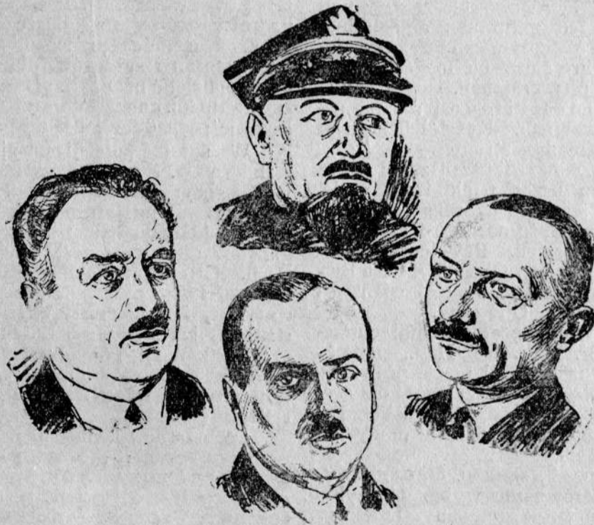
Dr. Świtalski (pravo) prezes ministrów. Dr. Czerwiński (lewo) minister W. R. i O. P. Prystor (u góry) minister Pracy i Opieki Społecznej. Matuszewski (na dole) minister skarbu.