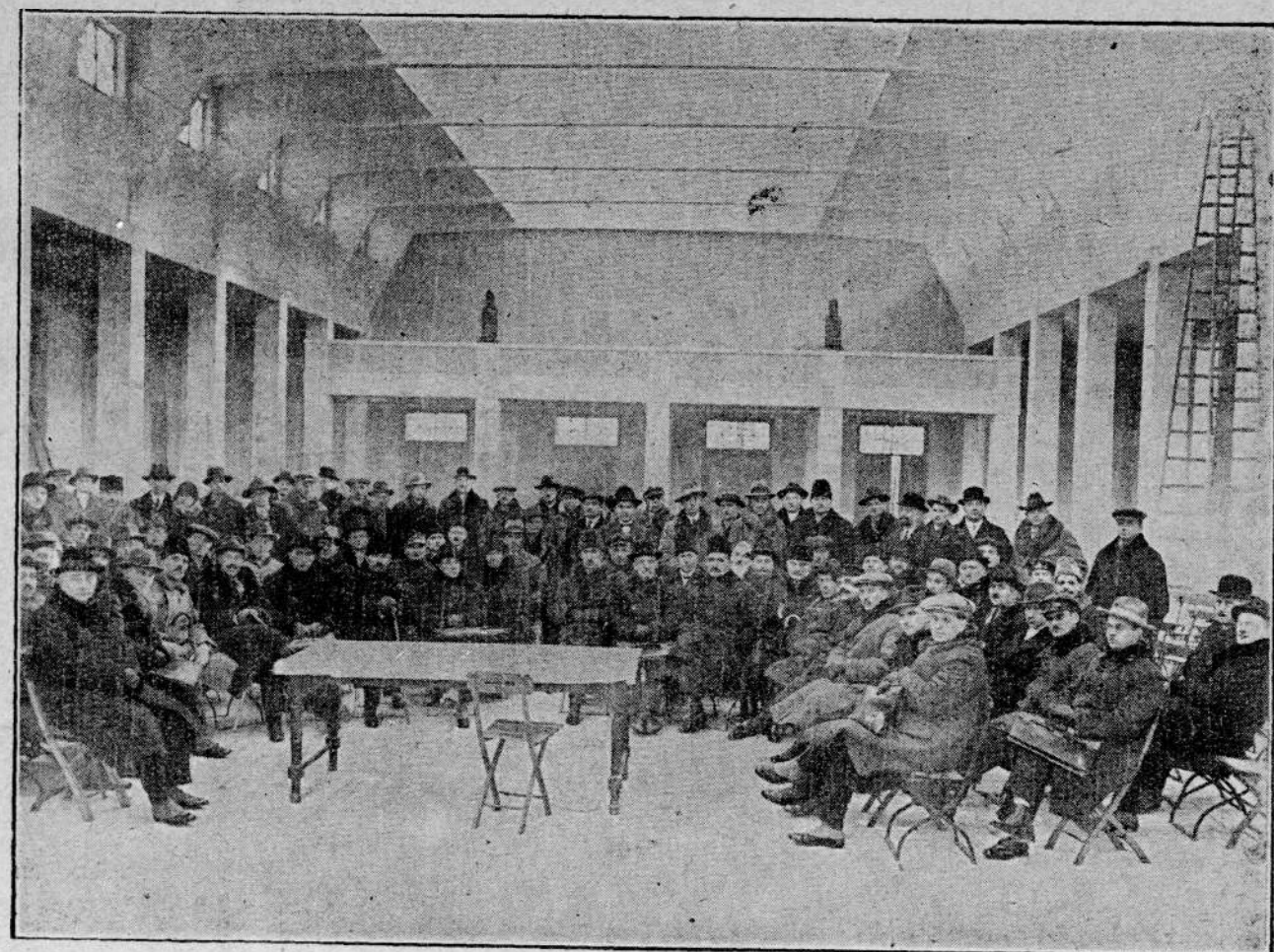
UCZESTNICY KURSU PRELEAGENTÓW — O CZEM PISZEMY OBSZERNIEJ NA INNEM MIEJSCU.

POMYSL zawczasu o tem, że POWINIENES i ty zwiedzić P. W. K.