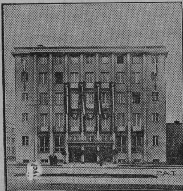
Nowy gmach B. G. K. w Gdyni wzniesiony według projektu inż. K. Jakimowicza.