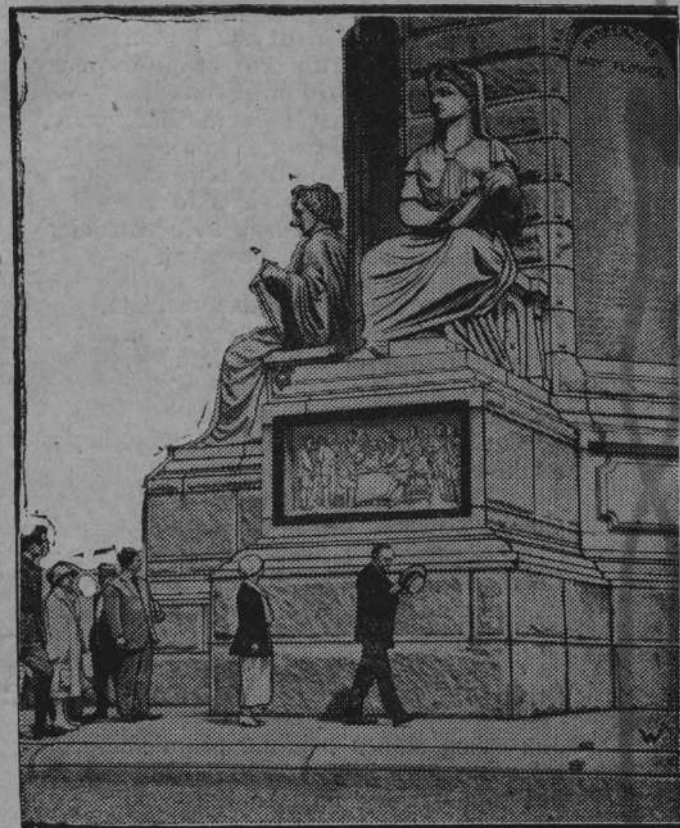
Prezydent St. Zjedn. Coolidge przed pomnikiem Mayflower, wzniesionym w New Plymth na pamiątkę pierwszych kolonistów angielskich, którzy przybyli w r. 1620 na okręcie Mayflower, aby osiedlić się w Ameryce Północnej.