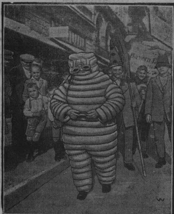
Figura reklamowa fabryki wyrobów gumowych.