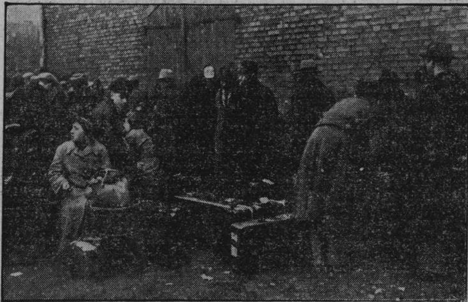
Z niepokojem w sercu i z walizkami w rękach tłoczyli się żydzi w pierwszych dniach swego pobytu w Zbąszyniu do miejsc rozdziału żywności.