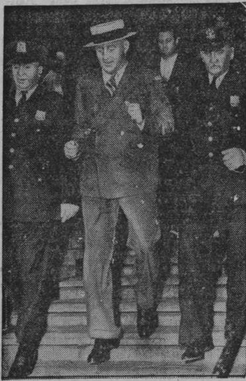
Przywódcą demokratów Tammany Hall Przywódcą amerykańskiej partii demokratycznej w Stanach Zjednoczonych Ameryki Tammany Hall oskarżony przed najwyższym sądem o przekupstwo.

Miasto od 36 godzin znajduje się w stanie alarmu i przygotowania do ewakuacji. Miejskowa straż przeciwpowodziowa oraz załoga pociągu „pomocy technicznej”, przybyłego z Berlina, budują tamy celem uchronienia miasta przed zupełnym zalaniem. W innych okolicach Śląska zanotowano na ogół spadek poziomu wód.