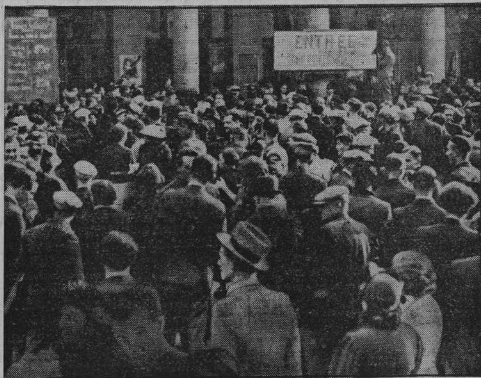
We Francji rozpoczęto pobór nowych roczników do służby stałej. Na zdjęciu rekruci na dworcu w Paryżu przed odjazdem do garnizonów w Metz i Strassburgu.