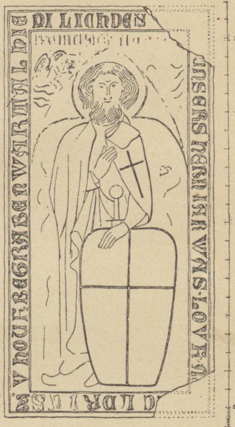
Grabstein des Hochmeisters Heinrich Lufemer in Marienburg

Der Gotländer Kalkstein ver­ trägt durchaus die Bearbeitung von vollplastischem oder Relief­ bildwerk, zahlreiche Säulen, Ka­ pitäle oder Gewölbe-Kragsteine beweisen das, auch die bekann­ ten Taufsteine und später die Grab­ steine des 16. und 17. Jahr­ hunderts. Trotzdem hat kein Stein­ meß in Preußen damals sich an Grabsteinen in solcher Arbeit versucht, man begnügt sich stets mit eingeritzten Linien. Die Gründe für dieses Vor­ gehen kann man kaum erraten. Im Halbdunkel der Kirchen, die ja oft farbig verglast waren, kamen diese eingeritzten Figuren wenig zur Geltung, nur die plastisch herausgearbeitete Schrift trat deutlich hervor, aber der Künstler war in der zeichneri­ schen Erfindung freier als bei einer plastischen Figur. Vergl. die drei Abbildungen. Vielleicht empfand man in der ebenen Fußbodenfläche das plastische Figurenwerk als hinderlich für den Verkehr; die reichen Fi­ gurengrabsteine des Westens hat man z. T. von Anfang an an die Wand gestellt oder auf erhöhte Tumben gelegt. Beides unterblieb aber in Preußen, wir haben jedenfalls einen dem Ordenslande eigentümlichen Stil für die Grabplatten. Dieses Bruchstück ist jetzt das älteste Bildnis einer deutschen Bürgerfrau des Ordenslandes; die Nikolai-Kirche hat ein neu gewonnenes Denkmal alter Kultur zu hüten.