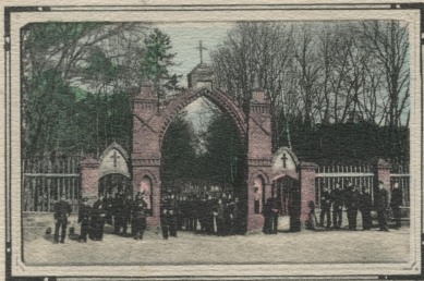
Dawna brama przy wjeździe do Borku