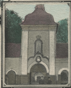
Brama prowadząca do Krużganków