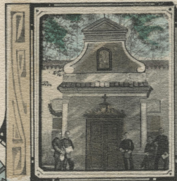
Kaplica w Borku