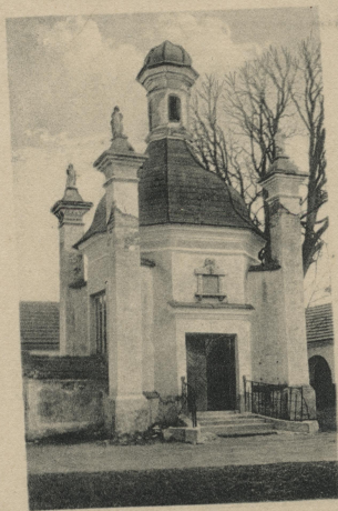
Kaplica przy klasztorze